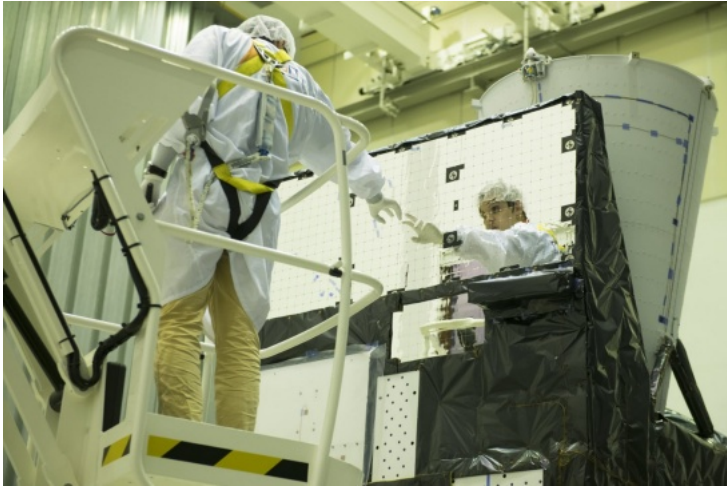
Fabrication de satellites dans le hall de production.