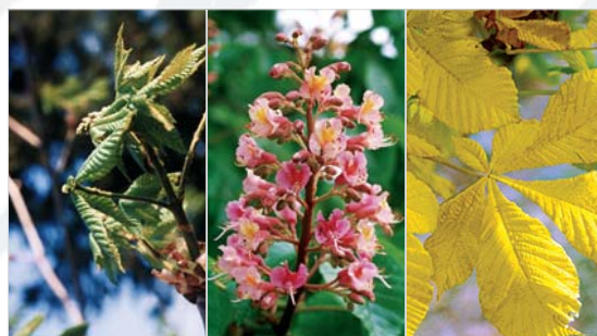
▲ Phänologische Phasen der Rosskastanie mit Blattentfaltung, Blüte, Blattverfärbung

Die Agrarmeteorologie ist ein Teilgebiet der Biometeorologie, die sich mit dem Einfluss von Klima und Wetter auf die Lebewesen befasst. 1951 gründete die MZA ein agrarmeteorologisches Messnetz, wo neben den üblichen Wetterelementen wie Lufttemperatur, Luftdruck, Wind etc. auch die Bodentemperaturen in verschiedenen Tiefen und die Verdunstung gemessen werden. Ebenfalls 1951 wurde ein Frostnetz errichtet. An rund 20 Messstationen in den wichtigsten Obst- und Rebanbaugebieten der Schweiz wurden die Feuchttemperatur und die Minimaltemperatur auf 50 cm über Boden gemessen sowie die Bewöl-