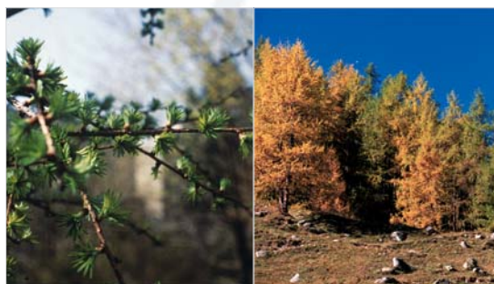
▼ Phänologische Phasen der Lärche mit Blattentfaltung und -verfärbung